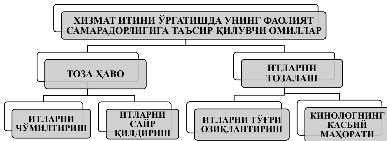
1-расм. Хизмат итини ўргатишда унинг самарадорлигига таъсир қилувчи омиллар 1

Ҳуқуқни муҳофаза қилувчи органларда бизнинг фикримизча хизмат итларининг махсус йўналишда хизмат вазифаларини бажаришдаги самарадорлик кўрсаткичини аниқлашимизда унга таъсир қилувчи қуйидаги омиллар ўрганилган (1-расм).