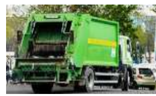
1-rasm. Chiqindilarni yig'ish va saralash marafonidan lavhalar.