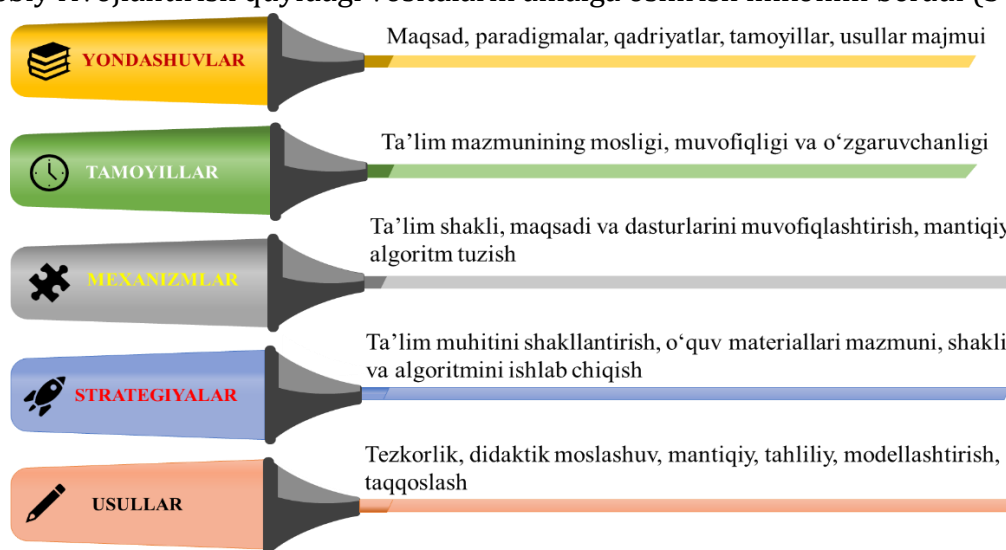
3-rasm. Boshlang'ich sinf o'qituvchilarini uzluksiz kasbiy rivojlantirish vositalari

Individual ta'lim trayektoriyasini loyihalash va amalga oshirish orqali oliy hamda malaka oshirish ta'limi mazmunining uzviyligi, jarayon uzluksizligining ta'minlanishi o'qituvchining sifat o'sishiga ijobiy ta'sir ko'rsatadi, o'zining kasbiy takomillashuvi subyektiga aylanishi, pedagogik faoliyati va shaxsini o'zgartirishi, aniq maqsadlarni belgilash, harakatlarini loyihalash, natijalari uchun mas'uliyatni zimmasiga olishni rag'batlantiradi. Uzluksiz kasbiy rivojlantirish quyidagi vositalarni amalga oshirish imkonini beradi (3-rasm):