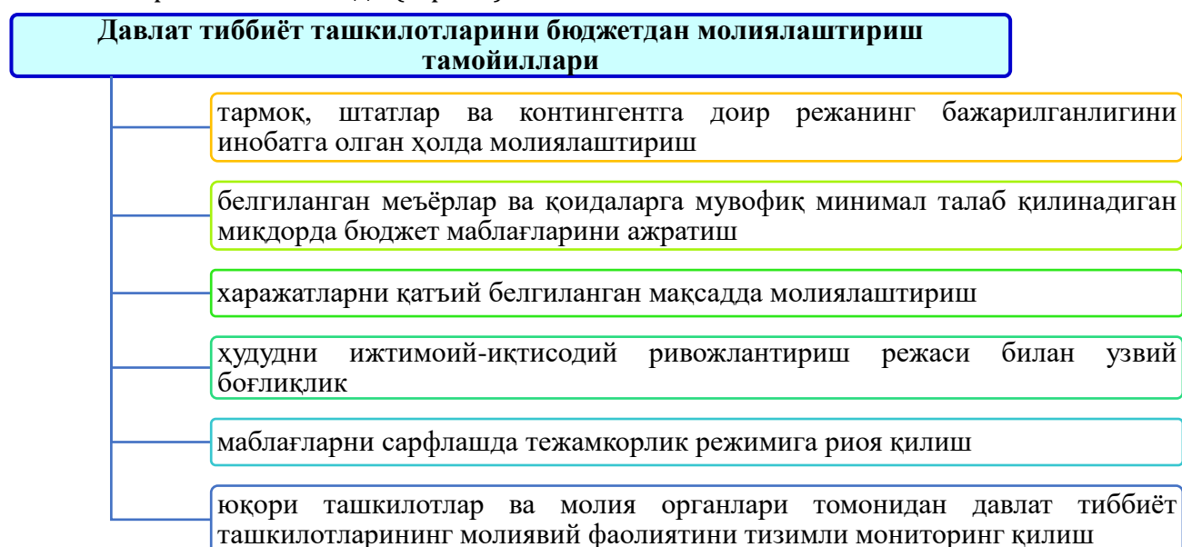
1 - расм. Давлат тиббиёт ташкилотларини бюджетдан молиялаштириш тамойиллари 1

Давлат тиббиёт ташкилотларини бюджетдан молиялаштиришда қуйидаги тамойилларга асосланилади (1-расм).