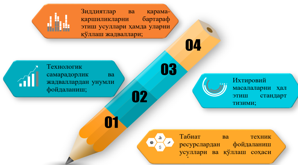
2-расм. ТРИЗнинг ахборот фонди[5].

ТРИЗ усулининг моҳияти турли техник масалаларнинг техник қаршиликлар туғдираётган жараёнлар орқали ечимини топиши мумкинлигида бўлиб, унда конкрет масалани умумлаштириш орқали ечимга муҳтож жиҳатларини ўрганиш орқали техник зиддиятларнинг чекли имкониятларидан кенг фойдаланишга асосланади. ТРИЗ усулининг асосини 40 та умумий ихтировий ёндашувлар ҳамда бир нечта муаммони ҳал этишга қаратилган 76 та стандарт андозаси мавжуд[4]. ТРИЗ нинг ахборот фонди мавжуд бўлиб, улар инновацион фаолиятни ривожлантириш, унинг қўлланилишини ҳар томонлама ҳисобга олиш, шунингдек тегишли номувофиқликларни бартараф этишга хизмат қилади (2-расм).