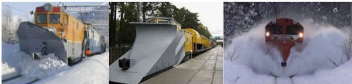
2-расм. Қордан темир йўллари тозалаш махсус поездлари

мақсадида, 766/765-сонли "Тошкент – Бухоро – Тошкент" йўналишидаги "Афросиёб" юқори тезликда ҳаракатланувчи электропоездлари қатновлари 2023 йилнинг 13,14,15-январ кунлари 3 та рейсга бекор қилинади"-деб хабар беради "Ўзтемирўйўловчи" АЖ матбуот хизмати. Ушбу ҳолат бўйича Ўзбекистон аномал совуқ ва қиш фаслига тайёр эмаслигини билдиради. Хорижий давлатларда аномал қиш, темир йўллари қор қоплаганида замонавий поездлар ёрдамида йўллари тозалаётганлигини гувоҳи бўласиз (2-расмга қаралсин). Ўзбекистон эса ҳали ҳануз кўл меҳнатидан фойдаланилаётганлиги кўриш мумкин. Ушбу ва шу каби "Ўзбекистон темир йўллари" АЖдаги муаммолар ушбу тизимда ислохотларни талаб қилади.