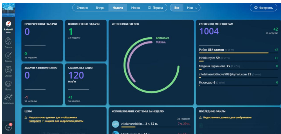
1-rasm. CRM ish stoli

Sayohat CRM — bu sayohat va sayyohlik kompaniyalariga mijozlar bilan munosabatlarini bitta bulutli to'plamdan boshqarishga yordam beradigan dasturiy ta'minot. CRM sayyohlik agentligi mijozlarni ushlab turish va sotishni oshirishda yordam beradi.