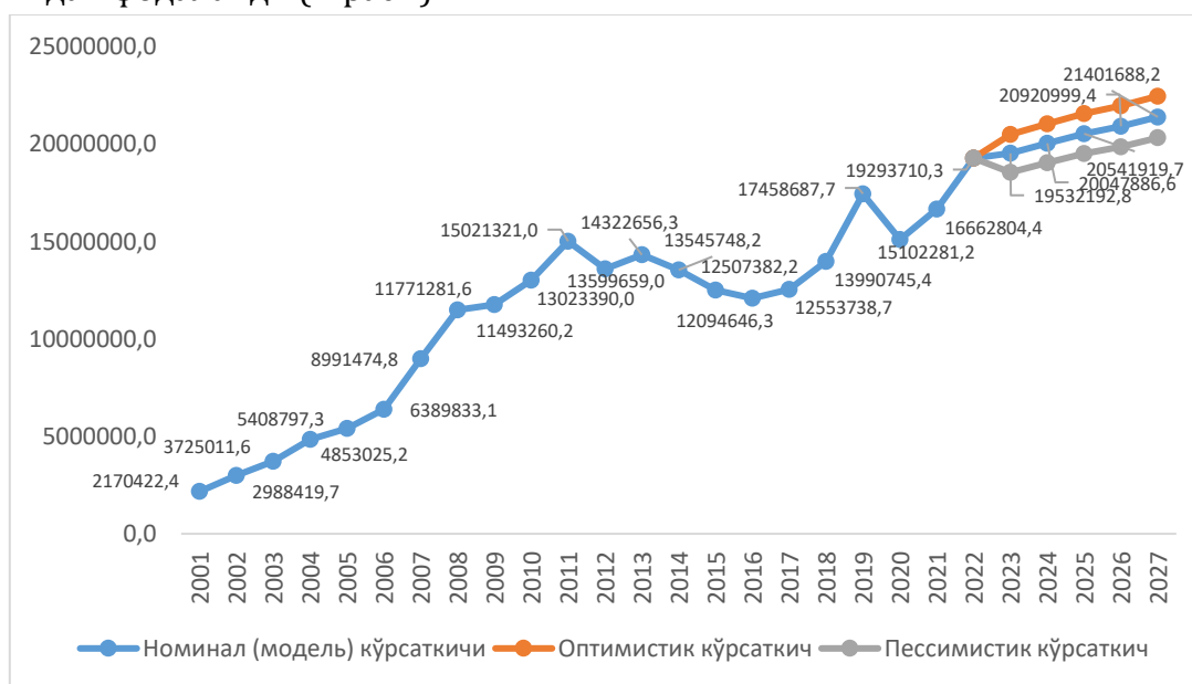
1-расм. Мамлакат умумий экспорти ҳажми кўрсаткичининг 2001-2027-йилларда ўзгариши, минг АҚШ доллари (2023-2027 йиллар прогноз кўрсаткичлари)

Кўп омили эконометрик моделдан фойдаланган ҳолда умумий экспорт ҳажмининг узоқ муддатда, яъни 2001-2027-йилларда ўзгариши қийматлари график кўринишда ифодаланди (1-расм).