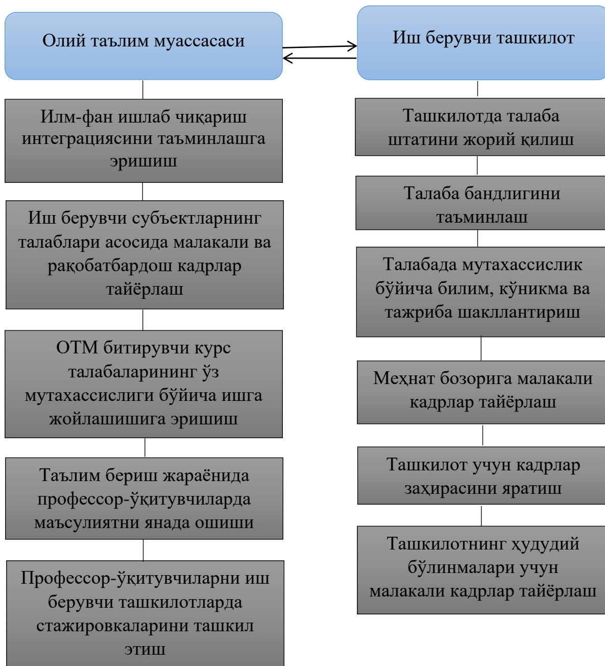
3-расм. ОТМ ва иш берувчи ташкилот ҳамкорлигида “талаба штатини” жорий этиш ва амалга ошириш жараёни 1

янада кўпроқ ишлашни талаб этса, талабаларда ўқув жараёнида замонавий билимларни эгаллаш бўйича ўз фикр-мулоҳазаларини баён этиш учун кўникма шаклланишига тўртки бўлади (3-расм).