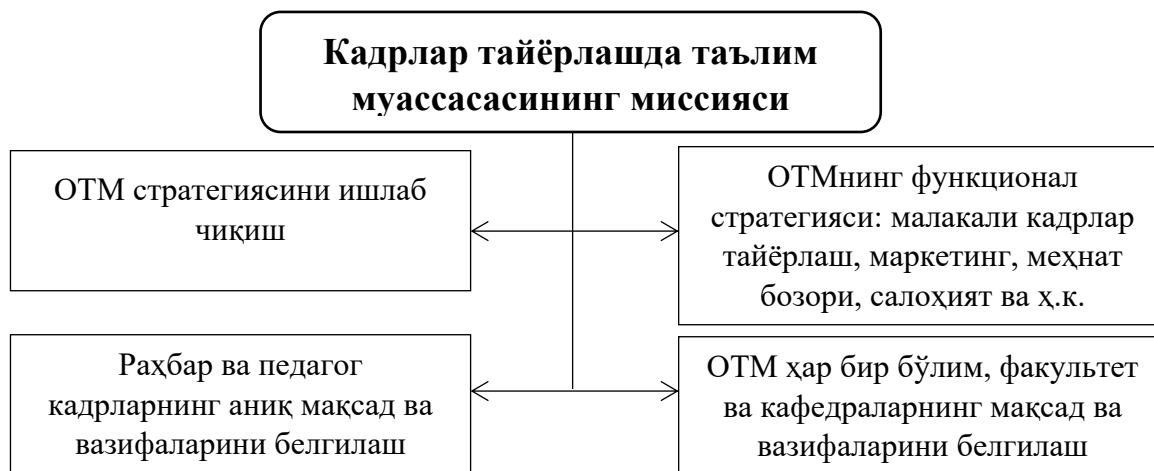
2-расм. Кадрлар тайёрлашда таълим муассасасининг миссияси 1

Шу билан бир қаторда аграр таълим тизимида кадрларни ишга жойлаштиришда раҳбар ва ходимлар ўртасида бошқарув амалиётидаги вужудга келадиган хилма-хил муаммолар орасида, албатта, асосий биринчи ўринда раҳбар фаолиятининг мазмуни, раҳбарнинг индивидуал фазилатлари билан боғлиқ масалалар мажмуи эгаллайди. Шу боис, ташкилотни самарали бошқаришда ходимларнинг ўз ишларига муносабатини ўрганиш, уларнинг таклиф ва тавсияларига эътибор бериш муҳим ҳисобланади. Хусусан, аграр таълим муассасалари меҳнат бозорининг талабларини инобатга олган ҳолда кадрлар тайёрлаш бўйича ўзларининг асосий миссиясини танлаб олиши зарур ҳисобланади (2-расм).