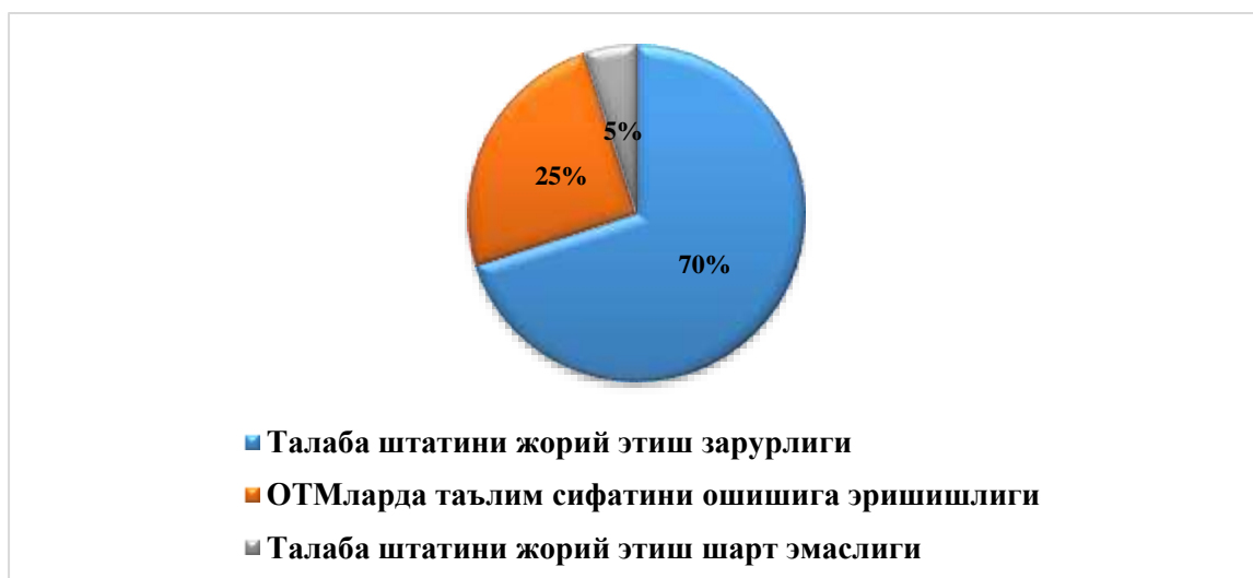
4-расм. Сўровнома асосида талаба штатини жорий этиш зарурияти 1

Бундан ташқари, аграр соҳа корхоналари билан ҳамкорликда ташкилотларда талаба штатларини жорий этишнинг қуйидаги афзалликлари, ОТМ ва ташкилот меҳнат бозори учун малакали, рақобатбардош кадрлар тайёрлашга эришиши кўришимиз мумкин бўлади (1-жадвал).