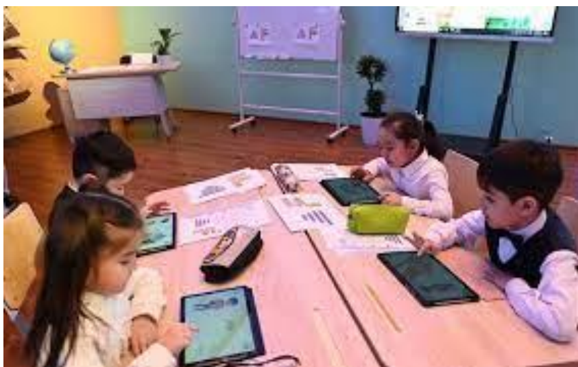
1-rasm. Gadjetlar orqali vizuallashtirilgan ma'lumotlardan foydalanish.

O'yinga asoslangan ta'lim yosh o'quvchilarning ijodkorligini, tanqidiy fikrlash va muammolarni hal qilish ko'nikmalarini oshirishning ajoyib usuli hisoblanadi. Bu hayolotdan foydalanishga asoslangan. O'qituvchilar o'quvchilarga ijodiy qobiliyatlarini oshiradigan yechimlar va g'oyalarni taklif qilish erkinligini berishlari mumkin.[3]