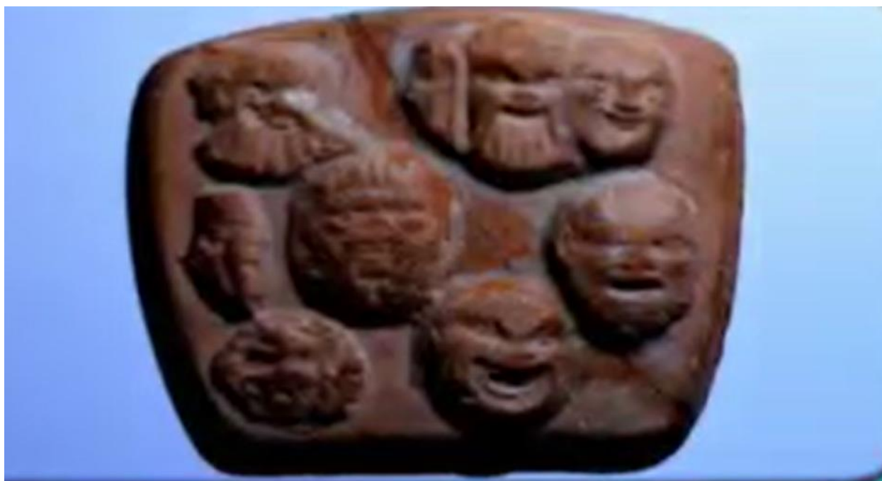
2-расм. Шулуқтапа ёдгорлигидан топилган милoddан аввалги I асрга oid актёрлик ниқоби

Хулоса. Қашқадарёдаги тожикларнинг урф-одат ва маросимлари Зарафшон воҳаси аҳолисининг одатларига яқин туради. Айрим қишлоқлардаги маросимлар бошқа худудларда кузатилмади. Бундай маросимларнинг сир-асрорлари фақат шу ерлик аҳолигагина маълум. Воҳа тожиклари ўтроқ маданият элементларини ўзида сақлаб қолган ва турмуш тарзи, хўжалиги, урф-одат ва маросимлари, меъморчилик, хунармандчилик ва кийинишига кўра ўзига хос этномаданий идентликда намоён бўлади.