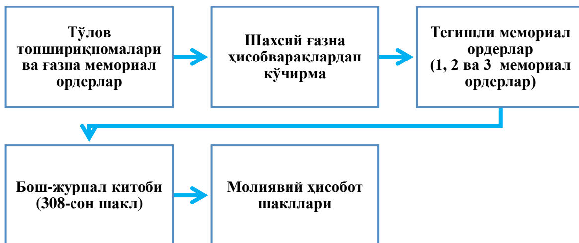
1-расм. Шахсий ҳисобварақлардаги пул маблағлари ҳаракати ҳисобини хужжатлаштиришнинг схематик кўриниши 1

Бюджет маблағлари бўйича шахсий ҳисобварақларда кун охирига қолдиқ бўлмайди. Яъни, бюджетдан молиялаштириш амалга оширилганда тегишли ёзувлар билан 232 (503 000) “Бюджетдан молиялаштириш” субсчёти билан боғланган ҳолда акс этирилади. Ғазна ижросига ўтмаган бюджет ташкилотлари бюджет пул маблағлари бўйича муомалалар банкларда очилган ҳисобварақларда амалга оширилади. Бу ҳисобварақларда ҳам ҳисоблашувлар тўлов топшириғи орқали амалга оширилади. Бюджет пул маблағлари ҳисобварағида муомалалар амалга оширилган кун охирига хизмат кўрсатувчи банк томонидан ҳисоб счётидан кўчирма тақдим этилади.