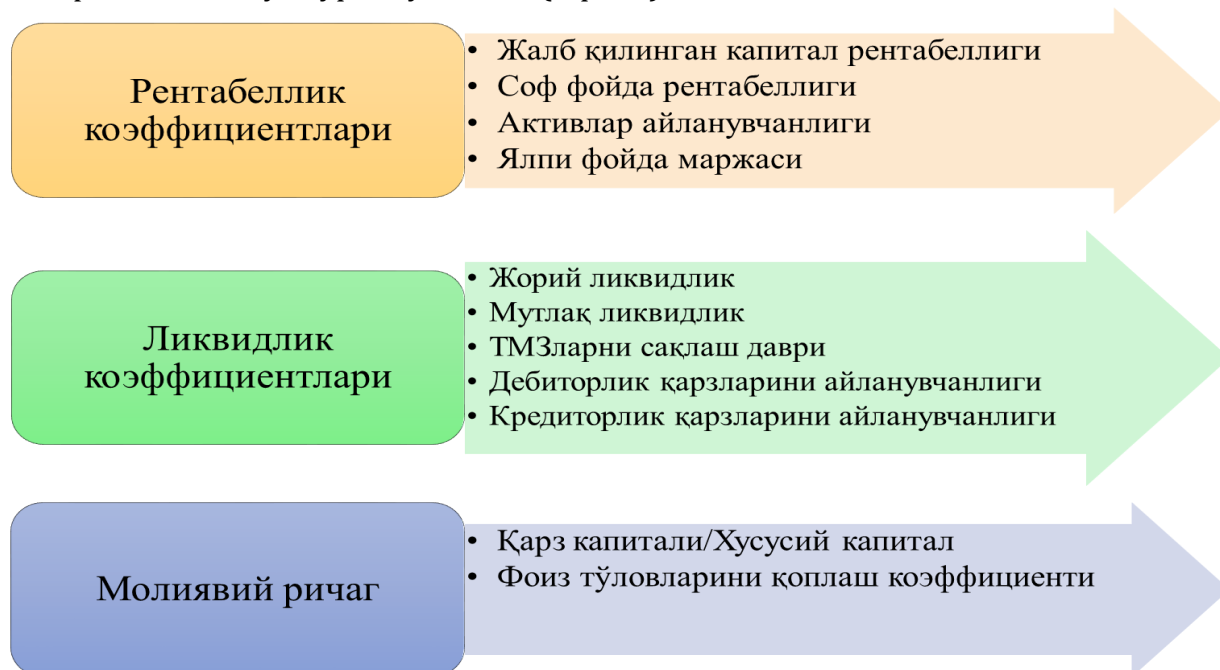
1-расм. Таҳлилий амалларни қўллашда фойдаланиладиган коэффициентлар таснифи 1 .

кўрсатиш rischi даражасини баҳолашдир. Муҳим бузиб кўрсатиш rischi даражасини баҳолашда эса таҳлилий амалларни бевосита қўллаш аҳамиятлидир. Шунингдек, таҳлилий амаллардан фойдаланиш хўжалик юритувчи субъект молиявий ҳисоботидаги аудиторлар хабардор бўлмаган томонларини кўрсатиши мумкин ва аудит амалининг моҳияти, давомийлиги ва ҳажмини аниқлаш учун муҳим бузиб кўрсатишлар riskини баҳолашга ёрдам беради. Таҳлилий амалларда қўлланиладиган коэффициентлар тасниф жиҳатидан уч турга бўлинади (1-расм).