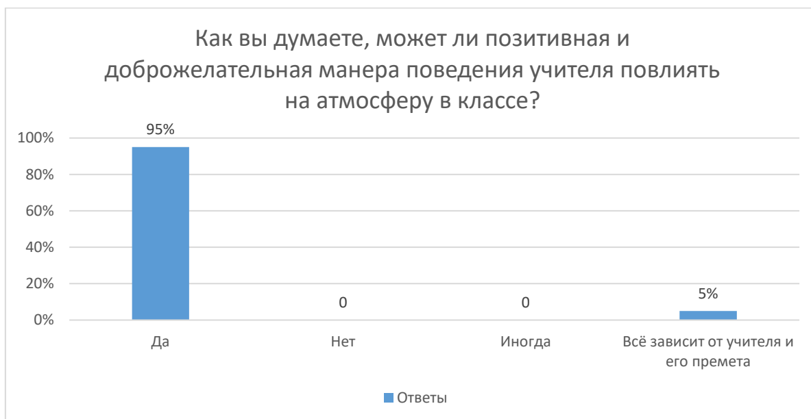
Таб. 1. Влияние манеры поведения учителя на психологический климат в классе

Как мы видим на этом графике, 95% респондентов считают, что позитивная и доброжелательная манера поведения учителя существенно влияет на психологическую атмосферу в классе. 5 % респондентов ссылаются на предмет и учителя. Эта статистика показывает, что ученики обращают внимание на манеру поведения своего педагога.