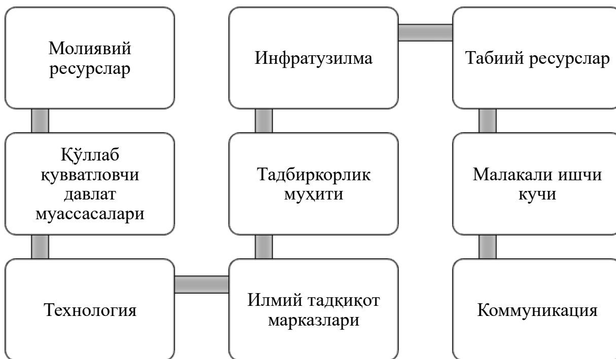
2-расм. Саноат корхоналарининг кластер тизимига ўтишида таъсир қилувчи омиллар

Саноат корхоналарининг кластер тизимига ўтиши учун бир нечта омиллар ҳисобга олинади (2-расм).