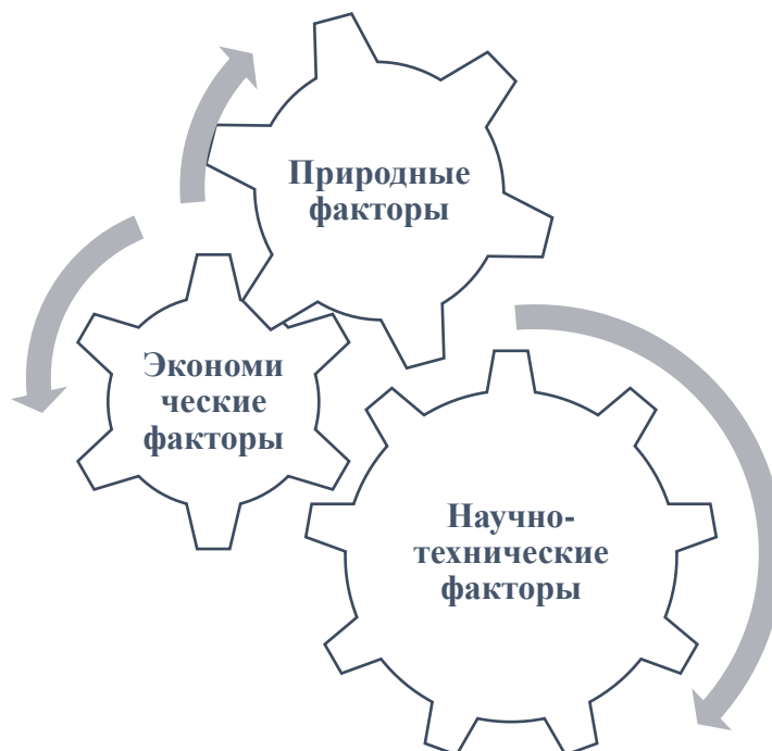
Рисунка 2. Факторы, влияющие на производство продукции в дехканских и подсобных хозяйствах [10]

инновационные методы, а процесс производства продукции включает транспортные расходы, изменение цен на инфраструктурные услуги и т. д.