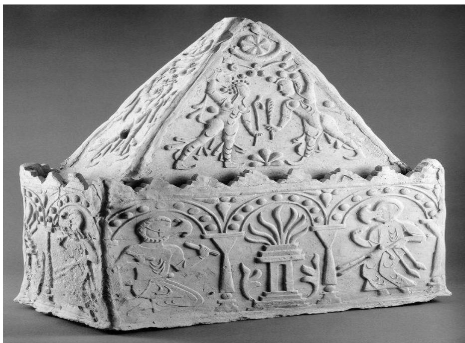
2-rasm. Ossuariy. Mulla Qo'rg'on. Samarqand. O'zbekiston.VII asr.