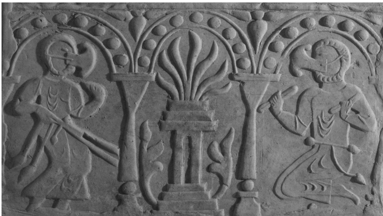
3-rasm. Ossuariyning pastki qism. Mazdakizm ruhoniylarining Afrinagan marosimini amalga oshirishi. Samarqand, Mulla Qo'rg'on.

Boshqa bezatilgan ossuariylar Sug'dlarning keyingi hayot haqidagi tasavvurlari haqida qo'shimcha ma'lumot beradi. Samarqandning janubidagi Shahrisabz vohasidan adolat xudosi Rashnning ruhni tortishini tasvirlaydigan ossuariy topilgan; Mihr va Srosh xudolari bilan u ruhning Chinvat ko'prigidan jannatga o'tishga loyqligini hukm qiladi; 4 – Rasm. Ma'lumot o'rnida, Chinvat ko'prigi (yoki Chinvat poli) zardushtiylik diniy tushunchalaridan biri bo'lib, insonlarning o'limidan keyingi taqdirini belgilaydigan ramziy ko'prikdir. Bu ko'prik orqali har bir insonning qilgan amallari asosida ruhining osmon (jannat) yoki do'zaxga yo'llanishi