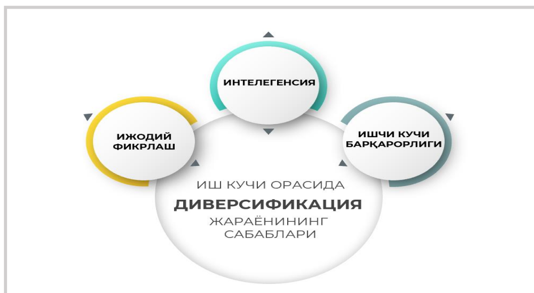
1-rasm. Ishchi kuchi orasida diversifikatsiya jarayonining sabablari[14]

Aslida bugun koʻplab mashhur kompaniyalar ishchi kuchi orasida diversifikatsiyani allaqachon yoʻlga qoʻyib boʻlishgan. Buning ham oʻziga yarasha sabablari bor, albatta (1-rasm).