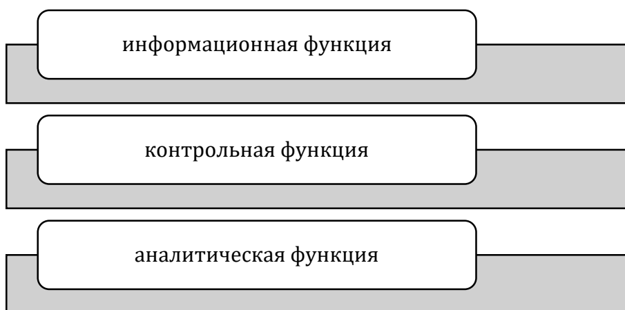
Рисунок 1. Функции бухгалтерского учета в системе корпоративного управления

Бухгалтерский учет в системе корпоративного управления выполняет информационную, контрольную и аналитическую функции.