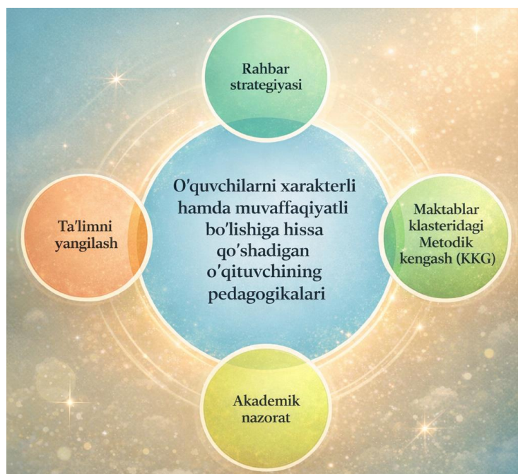
1-rasm. Tadqiqot modeli

Muhokama. O'tkazilgan tadqiqot natijalari bo'lajak o'qituvchilarning axborot-pedagogik kompetensiyasini shakllantirish va rivojlantirish jarayoni bosqichma-bosqich tashkil etilganda samaradorlik yuqori bo'lishini ko'rsatdi. Tadqiqot jarayonida olingan empirik ma'lumotlar hamda pedagogik tajriba natijalari asosida mazkur kompetensiyani rivojlantirish uchta o'zaro bog'liq bosqichda amalga oshirilishi maqsadga muvofiqligi aniqlandi. Ushbu bosqichlar diagnostik, rivojlantiruvchi hamda natijaviy bosqichlardan iborat bo'lib, ular talabalarning raqamli ta'lim muhitida samarali faoliyat yuritish ko'nikmalarini bosqichma-bosqich shakllantirishga xizmat qiladi.