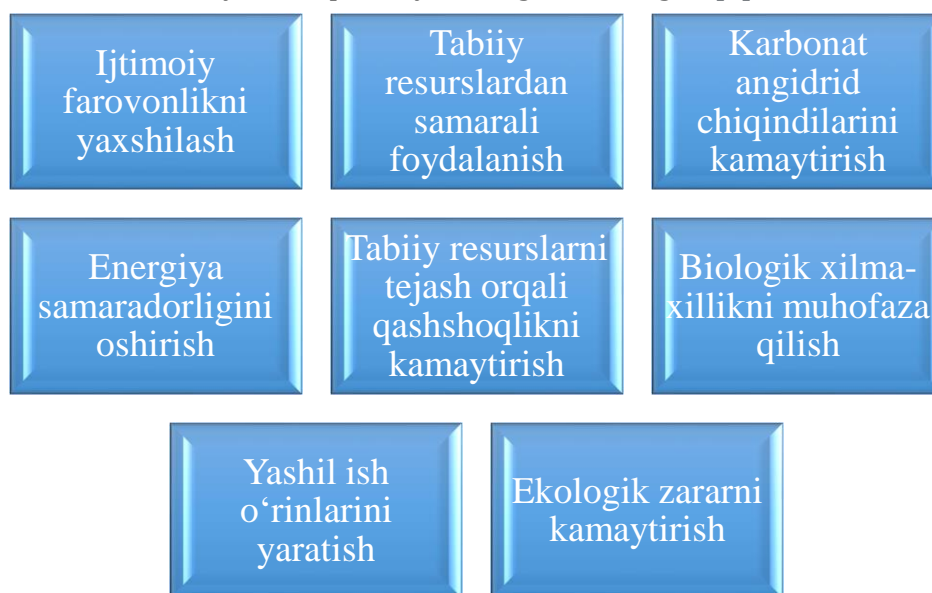
1-rasm. Yashil iqtisodiyotning asosiy maqsadlari*

Tahlil va natijalar. Yashil iqtisodiyot jamiyat va atrof-muhit uchun yaxshi istiqbolni ta'minlagan holda, bizning ichki va global iqtisodiy tuzilmalarimizga inklyuziv ekologik barqarorlik hamda global iqlim moslashuvini rag'batlantirish uchun juda muhimdir [4]. Yashil iqtisodiyot uzoq muddatli iqtisodiy o'sish, rivojlanish bizning farovonligimiz va iqtisodiyotimiz uchun zarur bo'lgan resurslar, xizmatlar, atrof-muhit, iqlimni ta'minlashni davom ettirish uchun tabiiy ekotizimlardan samarali va mas'uliyatli foydalanish hamda saqlashga bog'liqligini tan oladi. Yashil iqtisodiyotda imkon qadar kamroq issiqxona gazlari chiqariladi, kam uglerod chiqaruvchi iqtisodiyotga erishiladi; tabiiy resurslardan samarali foydalaniladi va chiqindilar kamayadi yoki yo'q qilinadi; iqtisodiyotda energiya samaradorligiga erishiladi, qayta tiklanuvchi energiya manbalarini to'la iste'mol qilishga o'tiladi; atrof-muhit ifloslanishini oldi olinadi; u ijtimoiy inklyuziv; u mavjud va kutilayotgan oqibatlarga moslashish bilan birga iqlim o'zgarishiga qarshi kurashadi; yashil iqtisodiy o'sishga asoslangan [6].