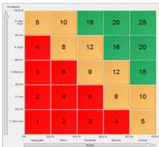
3-расм. “Alkim Tekstil” МЧЖда ёпик цикли иқтисодий тизим асосида ишлаб чиқариш орқали рискларни сўндириш натижасида имкониятларга эга бўлиш даражаси прогнози, 2023-2028 йй. [3; 55–62-б.]

Хулоса. Ёпик цикли иқтисодий тизимни фаоллаштиришда рискларни бошқариш кўрсаткичлари ўзгаришсиз қолмайди. Ёпик цикли иқтисодий тизим фаолиятида рисклар классификацияси техник, иқтисодий, ижтимоий, инвестицион, инновацион ҳамда савдо рискларига ажратилади. “Alkim Tekstil” МЧЖ да ёпик цикли иқтисодий тизимни татбиқ этиш натижасида рискларнинг сўндирилиши прогнози 3-расмда келтирилди.