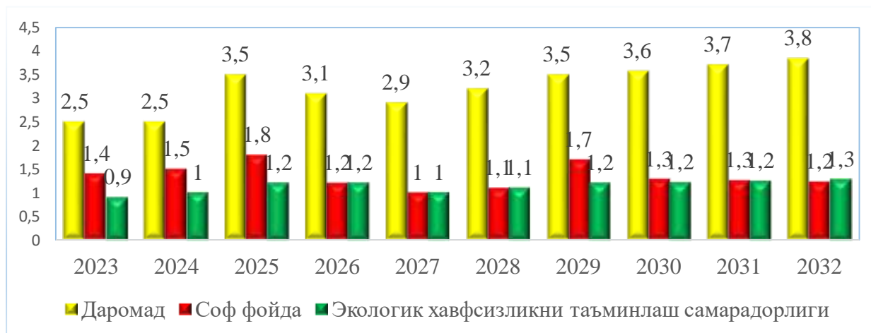
2-расм. “Alkim Tekstil” МЧЖда қичитқи ўтдан кулир мато ишлаб чиқаришнинг иқтисодий прогноз кўрсаткичлари, 2023-2032 йй (фоизда, 10 миллион тонна мато учун)

“Alkim Tekstil” МЧЖда қичитқи ўтдан мато ишлаб чиқаришнинг иқтисодий прогноз кўрсаткичлари АҚШнинг IBM компаниясининг “SPSS Statista 1.0” дастурида 3:1:2 омиллар нисбатида ARIMA да автокорреляция ҳамда регрессиядан фойдаланган ҳолда сарҳисоб қилинди. Бунда “Alkim Tekstil” МЧЖда қичитқи ўтдан мато ишлаб чиқаришда 1 туп мато ишлаб чиқариш синов натижалари хизмат қилди. (1 миллион тонна мато ишлаб чиқаришда икки қатлам тўқиш асосида 110 см ни ташкил этган, мато қалинлиги пахтага қараганда 2 г/м 2 кўпроқ, яъни 142 г/м 2 . Бир туп кулир 27 кг/(1,1*0,142)=172 855,31 м.)