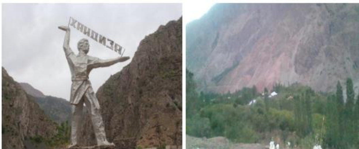
6-расм. Хонжиза тоғ ҳудуди

Сариосиё тумани Хонжиза тоғ ҳудудига ажратилган ер майдони 260 гектарни ташкил этиб, Термиз шаҳридан 200 км, Сариосиё туманидан 29 км масофада жойлашган. Ушбу масканга яқин қўшимча туристик объект Сангардак шаршараси ҳисобланади. Тоғли ҳудуд бўлгани боис, бино мавжуд эмас. Аммо, келгусида меҳмонхона, кемпинг, соғломлаштириш маркази, маданий кўнгилочар масканлар, катталар ва болалар дам олиш маскани, қишки оромгоҳ қуриш режалаштирилган.