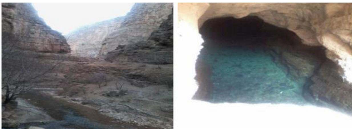
5-расм. “Хўжамайхона” тоғли ҳудуди

Ушбу ҳудудда баҳор, ёз ва куз ойларида саёҳатчиларнинг кўплигидан уларни жойлаштириш имконияти мавжуд эмас. Шунингдек, келгусида меҳмонхона, кемпинг, соғломлаштириш маркази, маданий кўнгилочар масканлар, катталар ва болалар дам олиш маскани, қишки оромгоҳ қуриш режалаштирилган.