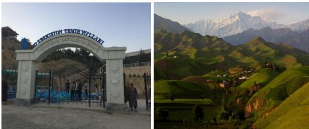
8-расм. Бойсун тумани Омонхона сиҳатгоҳи

Сурхондарё вилояти худудида бундан ташқари рекреация соғломлаштириш масканлари ҳам мавжуд бўлиб, булардан биринчиси Омонхона сиҳатгоҳи бўлиб, майдони 1,0 гектарни ташкил этади ва Бойсун туман марказидан 8 км масофада жойлашган. Узоқ йиллик тарихга эга Омонхона қуюқ арчазорлар билан қопланган. Омонхона булоқ суви таркибида кремней кислотаси, темир, алюминий ва бошқа микроэлементлар мавжудлиги аниқланган. Витамин ва минералларга бой булоқ суви инсон танасини, айниқса жигар, ўт пуфағи йўллари даволаш хусусиятига эга.