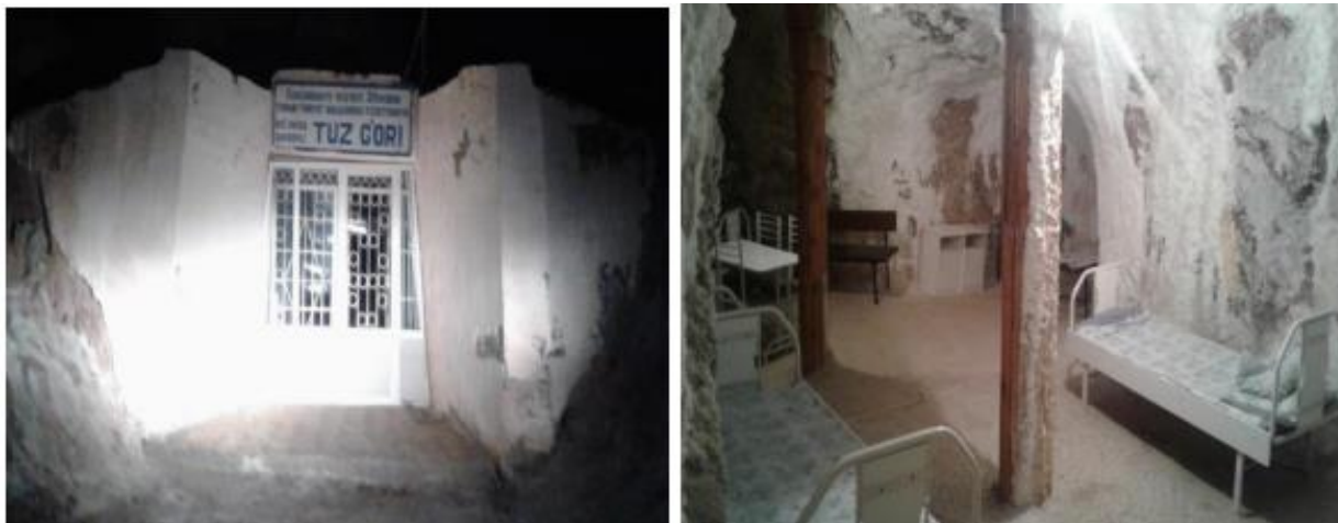
9-расм. Хўжайкон туз ғори табиий соғломлаштириш сиҳатгоҳи

Хўжайкон туз ғори табиий соғломлаштириш сиҳатгоҳи 16 гектар майдонга эга. Ушбу сиҳатгоҳ Шеробод тумани марказидан 63 км. масофада жойлашган. Худудга яқин қўшимча туристик объектлар сифатида туз тоғи, маҳаллий Ғўрим булоқ шифобахш булоғи, Шеробод Цемент заводи, Заравутсой қадимий ёдгорликларини келтириб ўтиш мумкин. Худуд электр энергияси, ичимлик суви мавжуд инфратузилмалаи билан таъминланган.