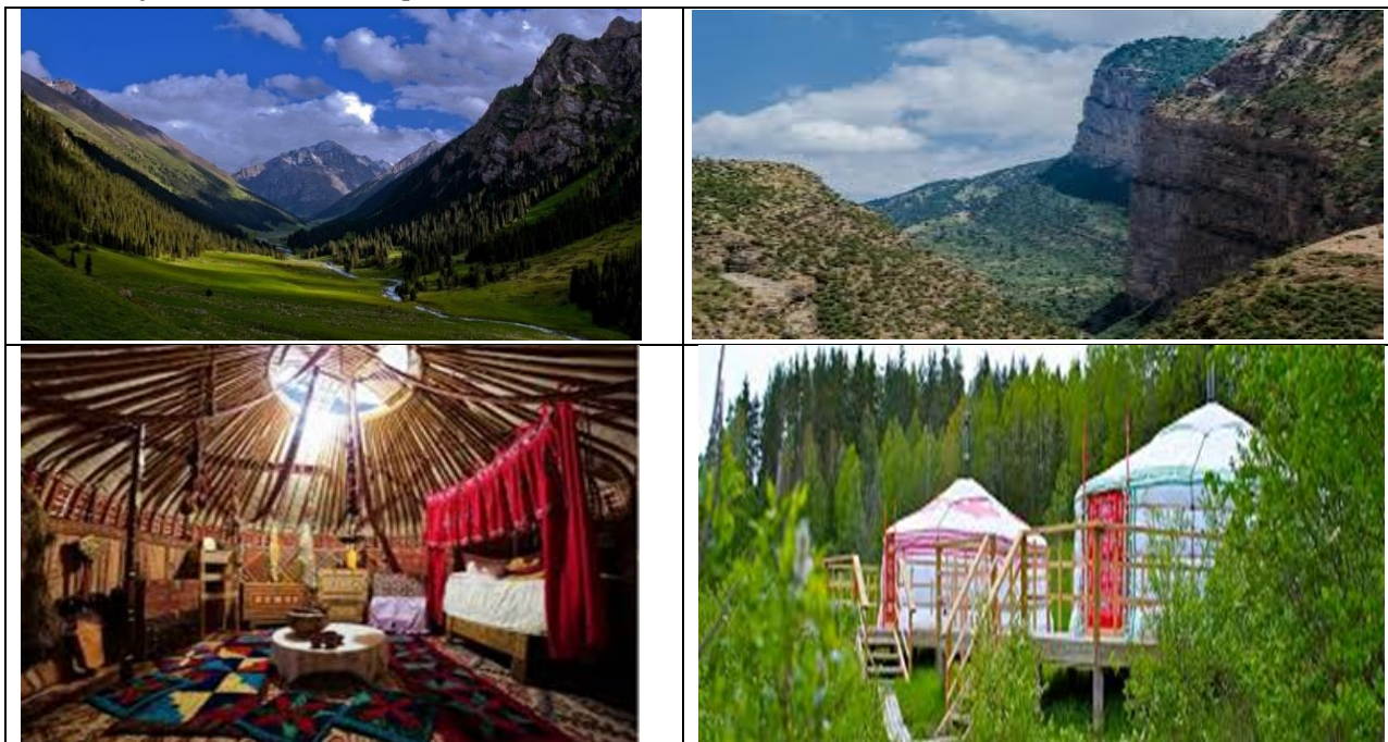
3-расм. “Олачапон” массиви Бузбарак дараси

“Кенгдала” массиви Хонкочди дарасида ташкил этилган экотуризм масканида сайёҳларга барча имкониятлар яратилган бўлиб, интернет, телекоммуникация тармоқлари, ўтовлардан ташкил этилган ётоқхоналар, экотуристлар учун йўналиш ва табиат қўйнида саёҳатлар ташкил этилган.