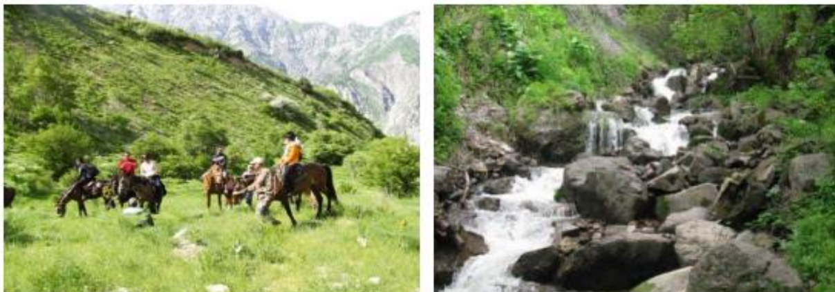
7-расм. “Қизилолма” маҳалласи Шалқон қишлоғи дам олиш зонаси

масофада жойлашган. Худудга яқин “Сурхон бешбулоқ” ва “Нефтчи” болалар оромгоҳи қўшимча туристик объектлар ҳисобланади. Худуд электр энергияси, ичимлик суви ва оқар сув инфратузилмалари билан таъминланган.