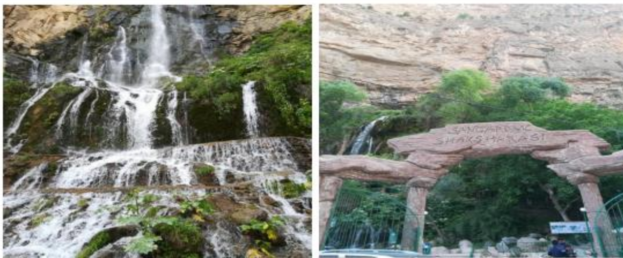
4-расм. Сангардак шаршараси

Сурхондарё вилоятининг маданий масканларига санъат саройи, археология музейи, вилоят кўғирчоқ театрини, сўлим гўшалари сифатида Цангардак шаршараси, Зовбоши маскани, Хўжамайхона, Омонхона, Хўжаипок, Хўжаикон тузғорларини келтириш мумкин.