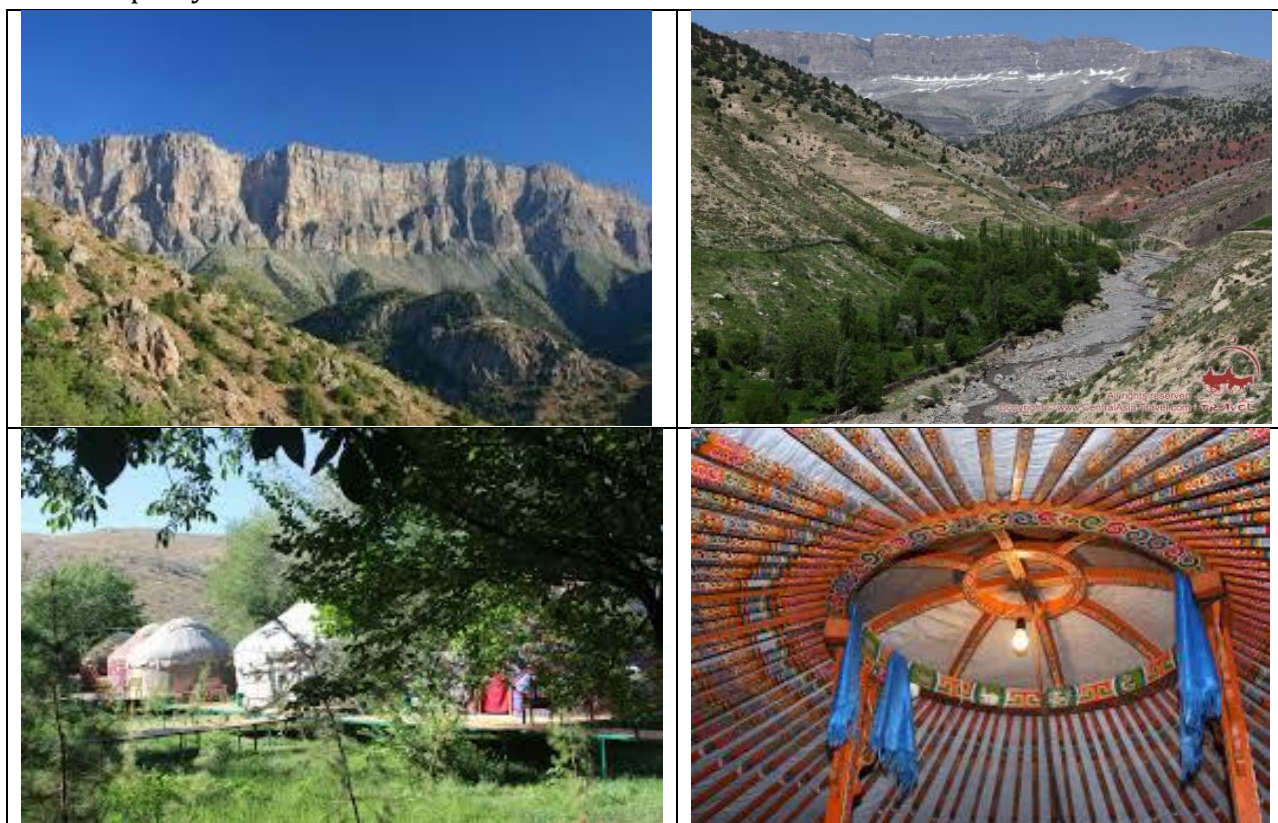
2-расм. “Кенгдала” массиви Хонкочди дараси

Ушбу масканда ташриф буюрувчиларга тоғ бағрига экскурсиялар, табиат қўйнида саёҳат ва меҳмонхоналар ташкил этилган бўлиб, бу ўз навбатида туристларни келишини ошишига олиб келмоқда. Ўрмон хўжалигини ривожлантиришнинг ижобий томонлари кўп.